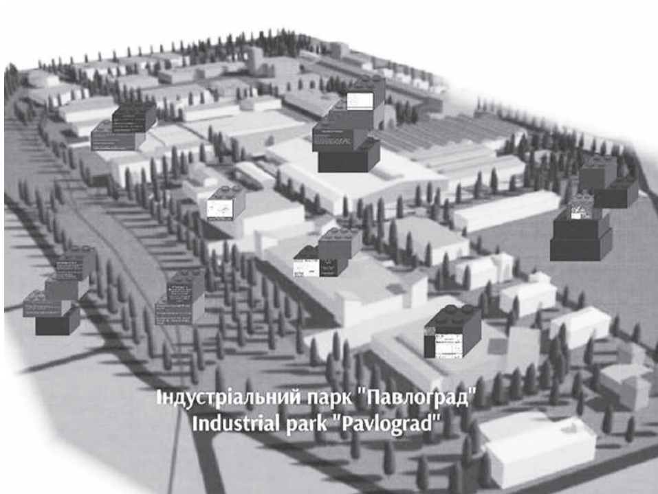
Індустріальний парк "Павлоград" Industrial park "Pavlograd"