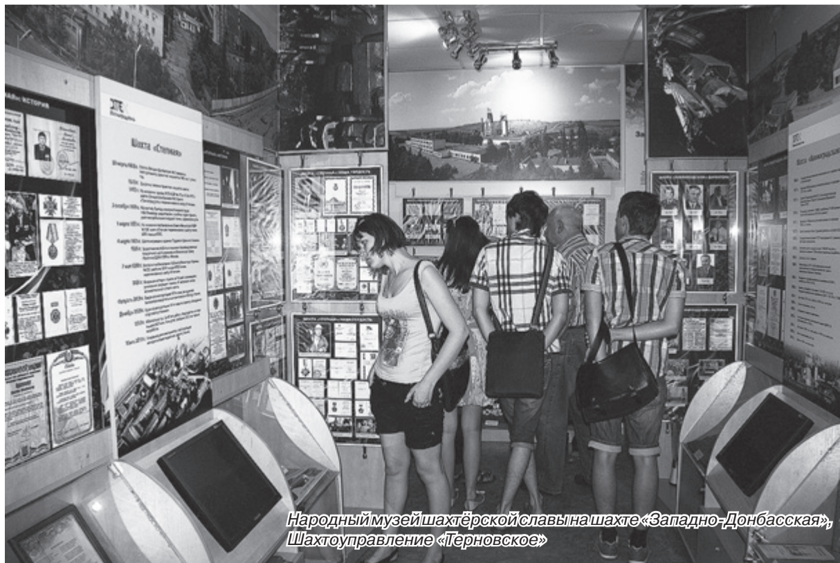
Народный музей шахтёрской славы на шахте «Западно-Донбасская», Шахтоуправление «Терновское»