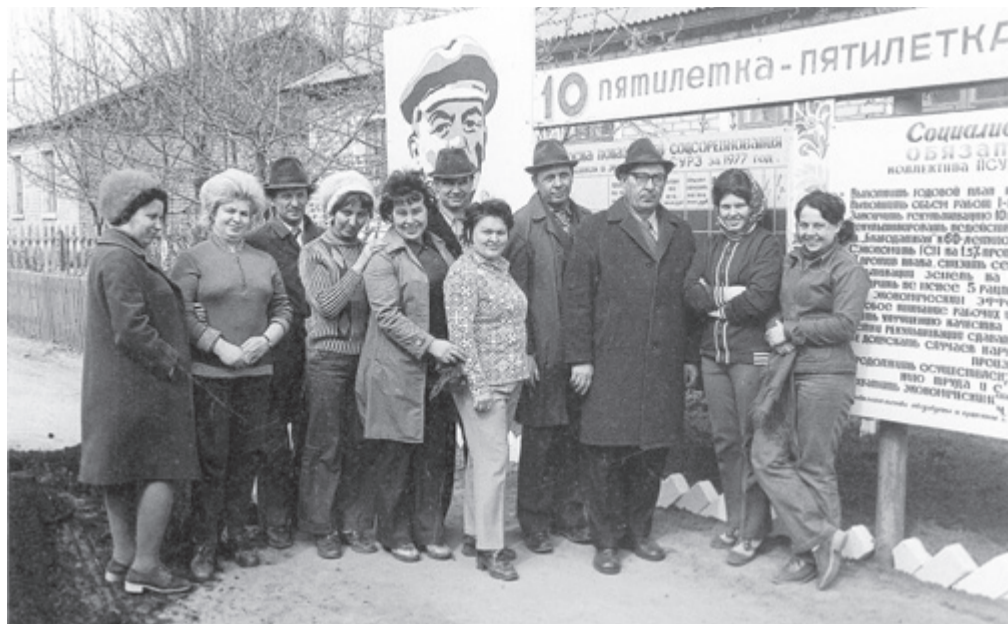
Екологічної програмою в 1974 році було передбачено створення ПСУРЗ, трудової колектив якої працював спільно з трестом «Укрюргеологія», НІІ «Дніпрогіпрошахт» по збереженню навколишнього середовища в Західному Донбасу