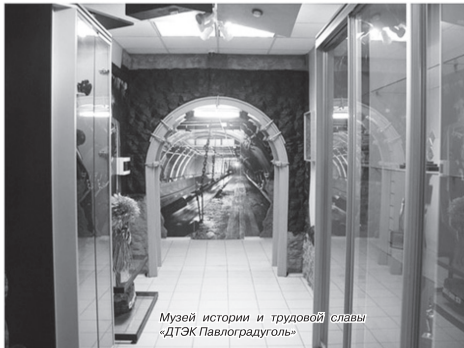
Музей истории и трудовой славы «ДТЭК Павлоградуголь»