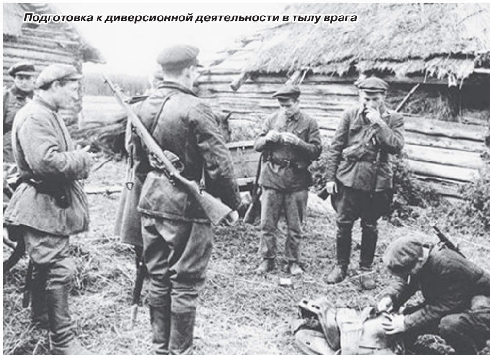
Подготовка к диверсионной деятельности в тылу врага