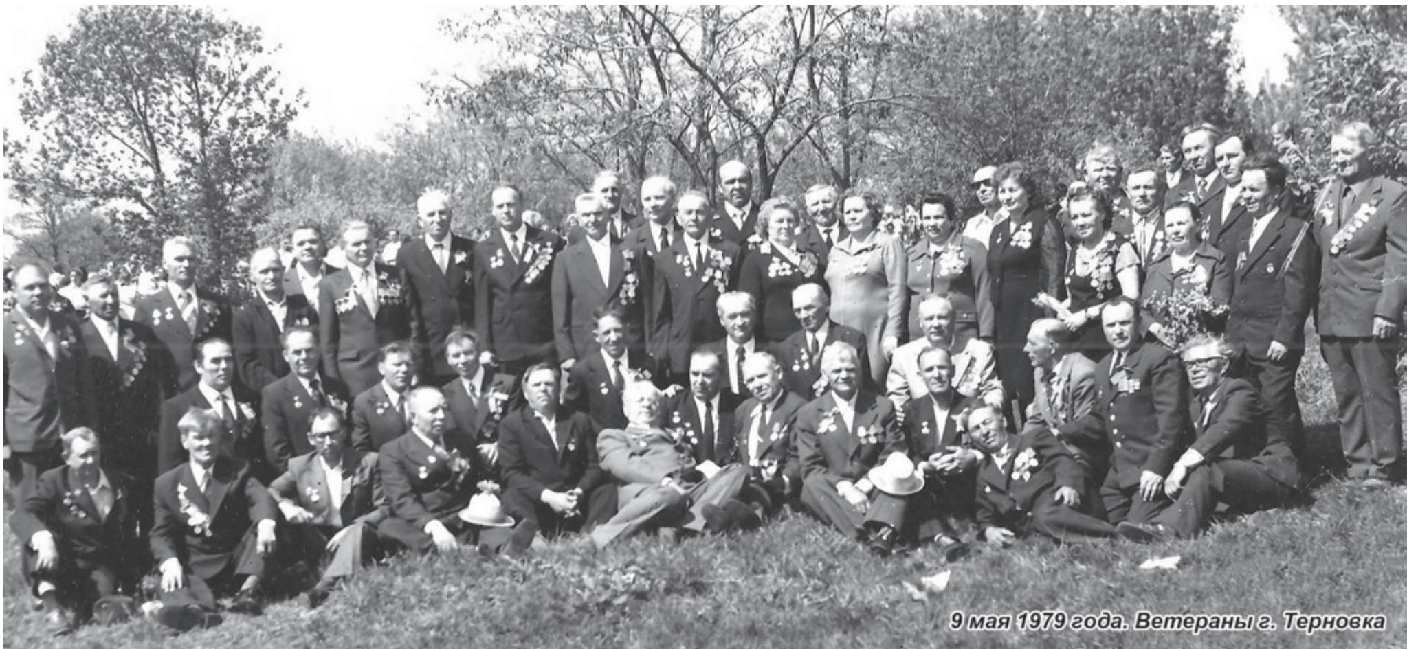
9 мая 1979 года. Ветераны г. Терновка