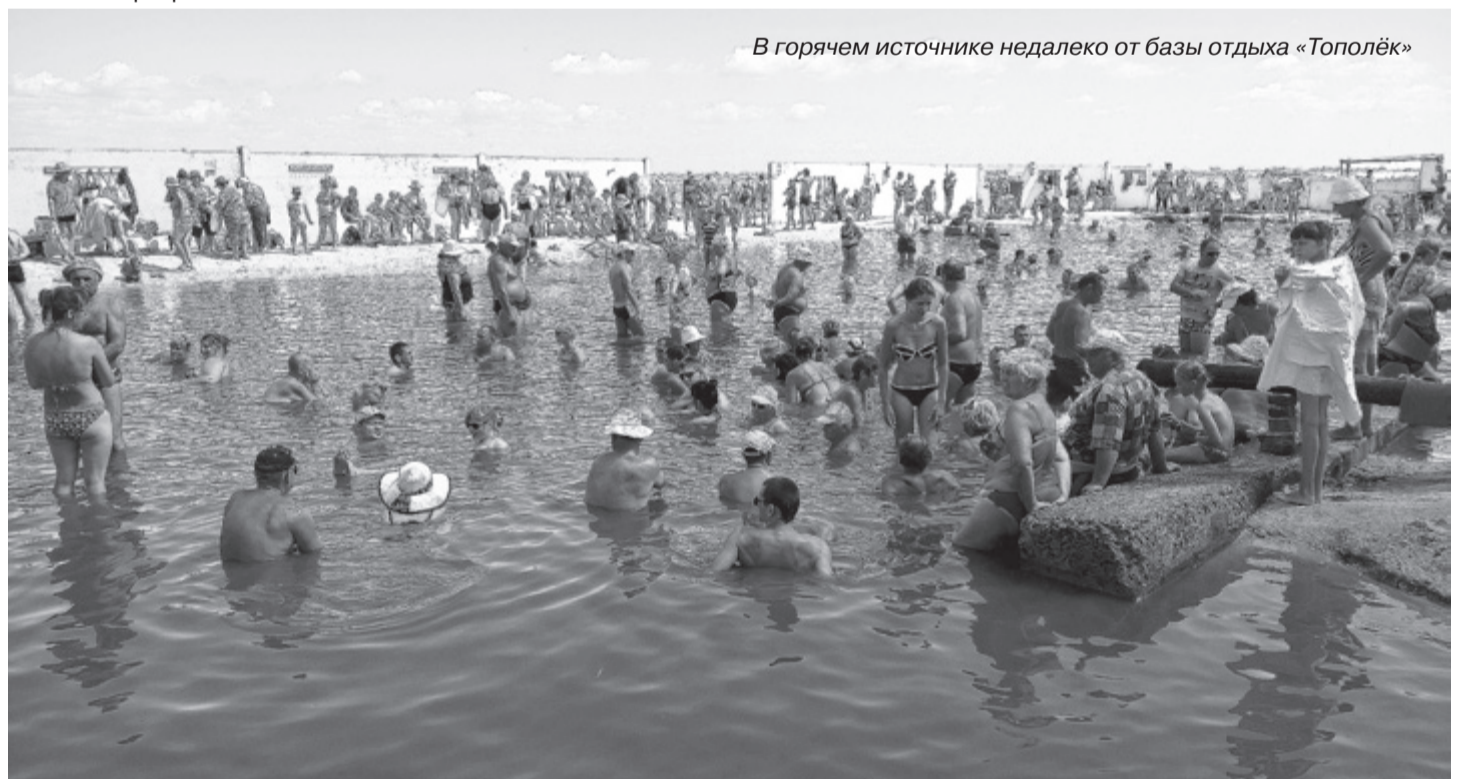
В горячем источнике недалеко от базы отдыха «Тополёк»