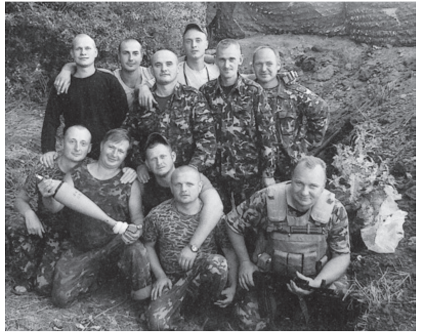
Воины. Защитники. Настоящие мужики.